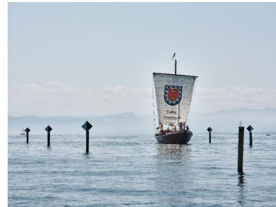
Themenfahrten auf der Lädine Wikinger- und Forscherfahrten, Sail & Wine