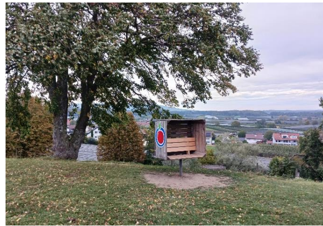
NEU: „Strandkörbe vom Bodensee“ – Sitzkisten auf dem Apfelweg