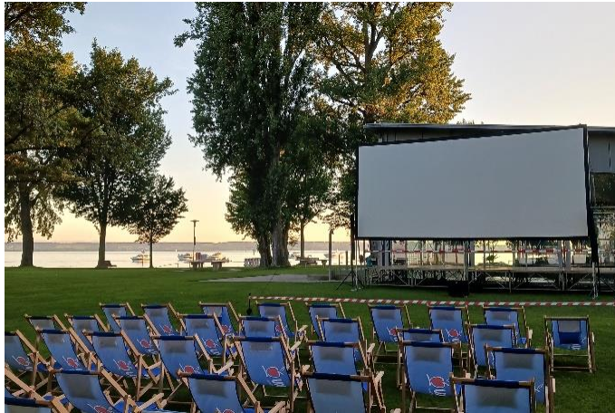
Open Air Kino im Aquastaad Juli und August