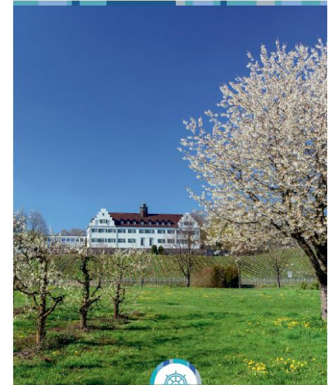
IMMENSTAAD BLÜHT AUF! 6. – 20. Mai 2023