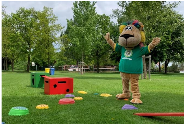
Familientag im Aquastaad