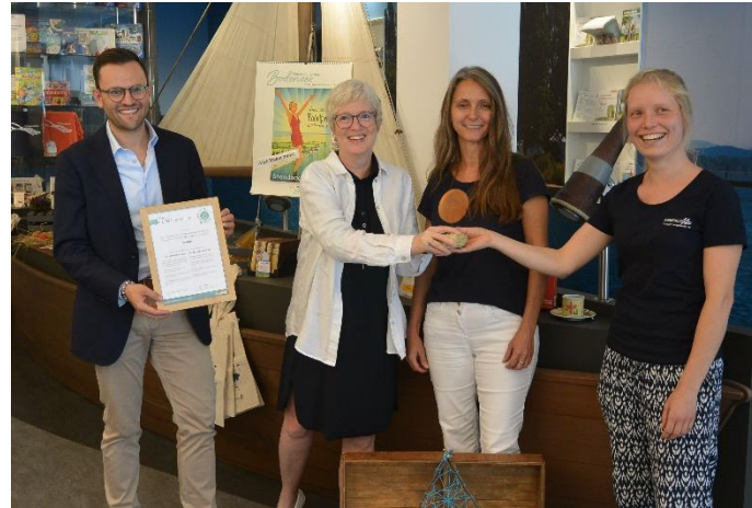
NEU: Konzeption einer neuen Actionboundtour „Immo & das Müllmonster“ – Auszeichnung als ECHT nachhaltiges Erlebnis