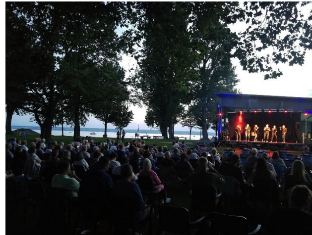
Open Air Konzert im Aquastaad August