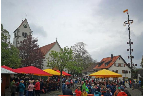
Maibaumstellen in Kippenhausen